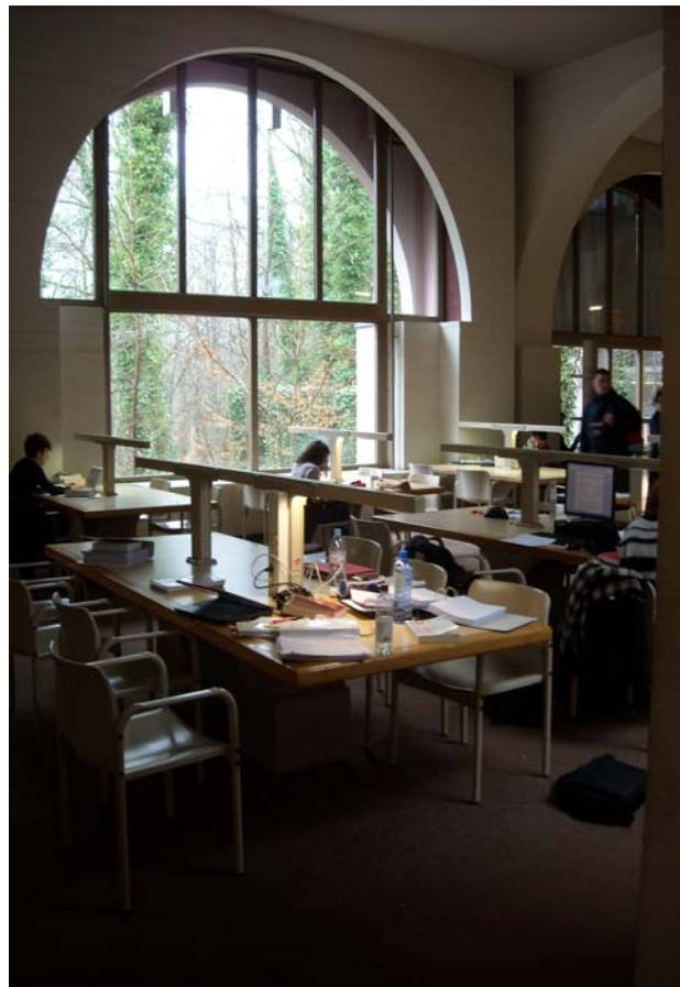
Zdj. 5. Biblioteka Léona Graulicha.

Dziesięć, jedenaście lat temu każdy wydział, instytut ULg posiadał swoją odrębną bibliotekę nazywaną centrum dokumentacji. W 2004 roku sporządzony został raport Digitalizacja i przyszłość Bibliotek Uniwersytetu w Liège . Dokument ten wyznaczył plan reorganizacji sieci bibliotecznej, tak aby dostosowała się do zmieniającej się rzeczywistości przy jednoczesnym zachowaniu swego dziedzictwa i historii. W efekcie 18 małych centrów dokumentacji przekształcono w sieć pięciu bibliotek: ALPHA to biblioteka humanistyczna oraz miejsce przechowywania kolekcji historycznej - manuskryptów, inkunabułów i starodruków; BST - biblioteka sztuk stosowanych i matematyczna; BSV - gromadzi m.in. publikacje z zakresu weterynarii, BSA - księgozbiór z zakresu agronomii oraz biblioteka Léona Graulicha na kampusie Sart Tilman.