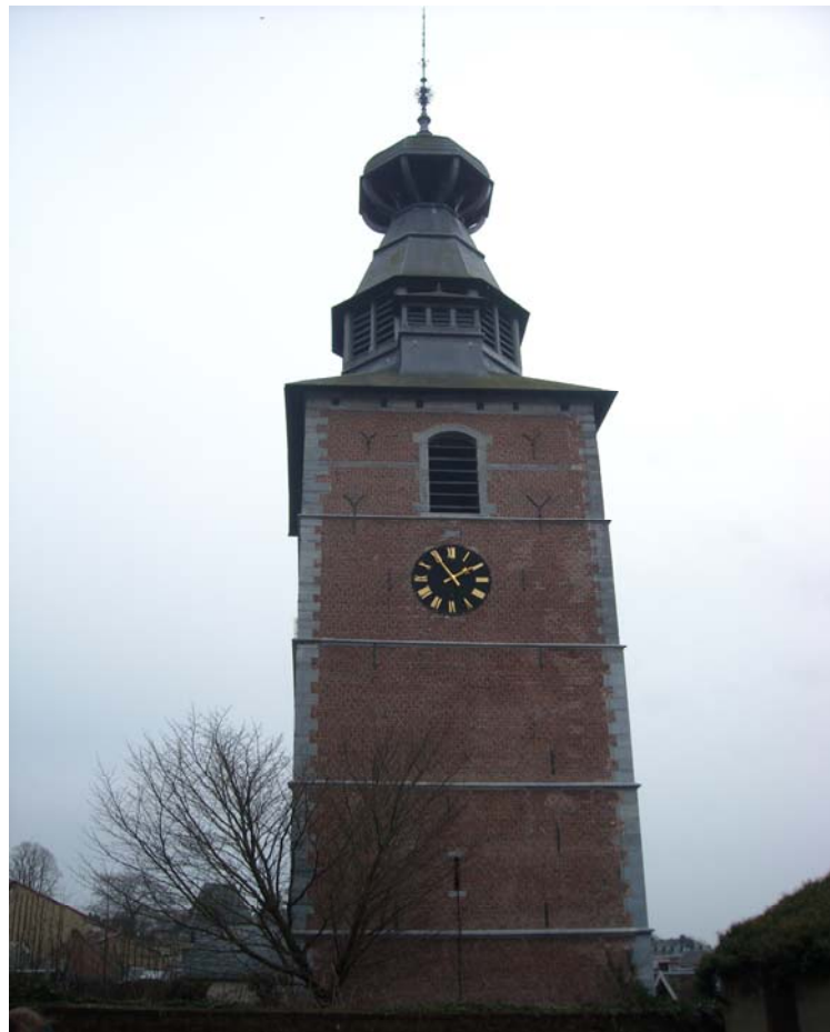
Zdj. 1. Wieża w Gembloux (lista UNESCO).

W bogatym programie szkolenia Inicjatywy Open Access: od bibliotek do badań naukowych oprócz wykładów, prezentacji i dyskusji znalazł się czas na wycieczki, związane ściśle zarówno z praktyką bibliotekarską, jak odwiedziny w Bibliotece Wydziałowej na kampusie Sart Tilman (Biblioteka Léona Graulich) oraz oprowadzanie po zakamarkach uniwersyteckich w pojezuickim kompleksie w Liège i pobenedyktynskich budynkach kampusu w Gembloux czy też zwiedzanie zabytków stolicy Ardenów podczas trzygodzinnego spaceru z przewodnikiem i historykiem sztuki - pracownikiem ULg. Podczas przechadzki po historycznym centrum Liège zobaczyliśmy najważniejsze obiekty sakralne miasta: katedralny kościół pod wezwaniem św. Pawła z nowoczesnymi kolorowymi witrażami kontrastującymi z gotycką bryłą i maswerkowymi oknami, wart odwiedzenia z uwagi na figurę Jezusa Chrystusa wyrzeźbioną przez ucznia Berniniego Jeana del Cour oraz kolejalny kościół Saint-Barthélemy, słynny z uwagi na romańską chrzcielnicę z brązu, wspartą na dziesięciu pięknie rzeźbionych wołach - dzieło Reniera de Huy z 1118 roku.