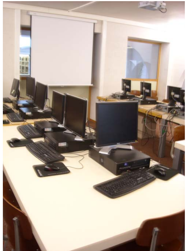
Zdj. 7. Czytelnia komputerowa w Bibliotece Léona Graulich.