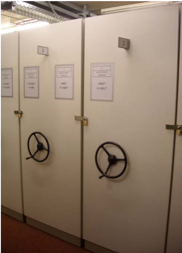
Zdj. 6. Regały kompaktowe w Bibliotece Léona Graulich.

Odwiedziny w ostatniej z wymienionych bibliotek stanowią ciekawą okazję do zapoznania się z tym, jak w praktyce można realizować założenia wolnego dostępu do półek. Nie ma tu podziału na magazyn i czytelnię. Stoliki przeznaczone dla czytelników otoczone są regałami z książkami. Niemal każda antresola i pokój zaadaptowane zostały na potrzeby czytelników. Stoły czytelniane przy oknach oddzielone są od pozostałej części biblioteki regałami z książkami. W centralnej części drewnianą kratownicą wydzielone są przestrzenie do pracy indywidualnej, ale i tutaj znajdują się regały np. z czasopismami. W pobliżu wejścia i lady bibliotecznej zlokalizowany jest mały pokój przeznaczony do celów reprograficznych. Czytelnicy samodzielnie kopiują potrzebne im materiały. Na niższym poziomie znajdują się kolejne regały, w tym kompaktowe - również tutaj studenci mają wstęp. Obok klatki schodowej mieści się pokój do pracy grupowej. Księgozbiór historyczny przechowywany jest w regałach kompaktowych zabezpieczonych kłódkami założonymi na zsunięte przęsta regałów, tak by uniemożliwić dostęp do nich osobom niepowołanym. Skoroszyty i publikacje, na które składają się luźne karty, zostały wydzielone i przechowywane są w odrębnym pokoju, do którego klucz udostępnia bibliotekarz. Specyficzność tego miejsca polega na częściowo prezencyjnym charakterze zbiorów - studenci pierwszego stopnia nie mogą wypożyczać książek na zewnątrz.