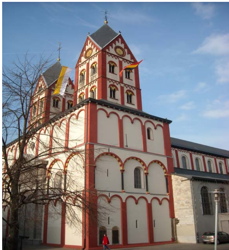
Zdj. 3. Odnowiona fasada kościoła Saint-Barthélemy.