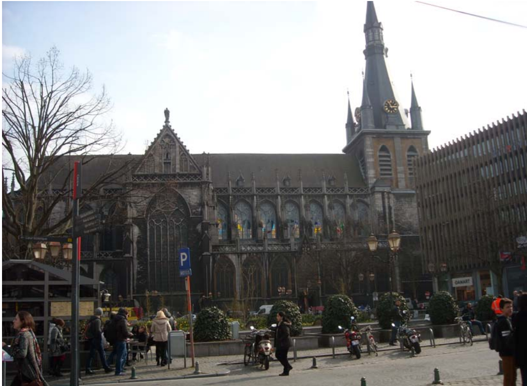
Zdj. 2. Witraże katedry św. Pawła.