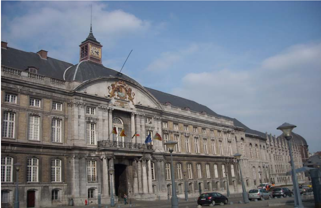
Zdj. 4. Pałac Książąt Biskupów.

Jednym z przystanków stał się również dziedziniec Pałacu Książąt - Biskupów sąsiadujący z nieistniejącą już pierwotną katedrą pod wezwaniem św. Lamberta, lokalnego świętego i biskupa, który zmarł w wyniku zamachu. Katedra zburzona została podczas rewolucji francuskiej. Na jej miejscu i w okolicy przy placu św. Lamberta powstało natomiast ciekawe muzeum – Archeoforum.