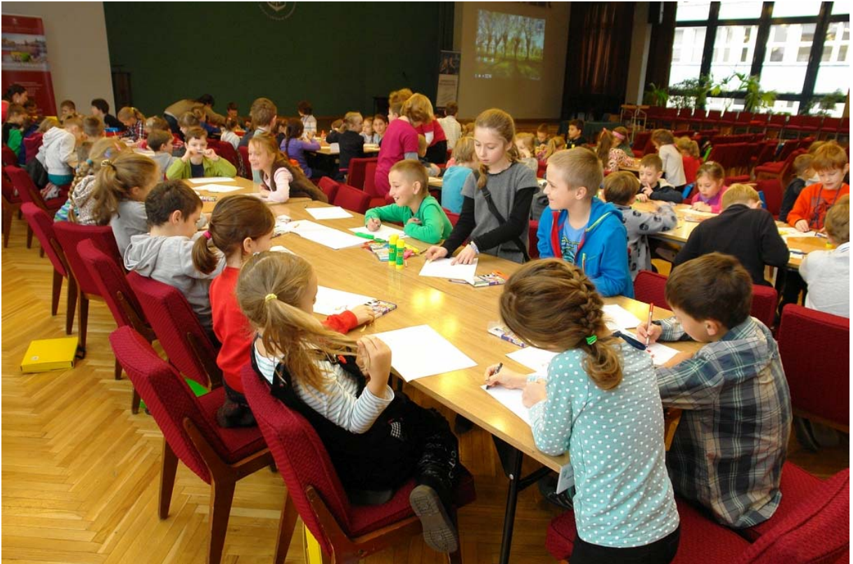
Zdj. 3.

Natomiast tematyka zajęć Z książką za pan brat była dostosowana do grup różnych wiekowych - dla dzieci w wieku 6-7, 8-9 i 10-12 lat. Podczas spotkań przedstawiono rangę książek od czasów najdawniejszych po dzień dzisiejszy oraz podkreślono istotę wynaleźnienia druku. Zaprezentowano biblioteki światowe i polskie, które pełnią istotne funkcje we współczesnym świecie. Ponadto elementem, który urozmaicił zajęcia, był pokaz nietypowej architektury bibliotecznej oraz replik bibliotek zbudowanych z klocków lego. Słuchacze poznali także najnowsze formy książki takie jak: e-book, audiobook, papier elektroniczny.