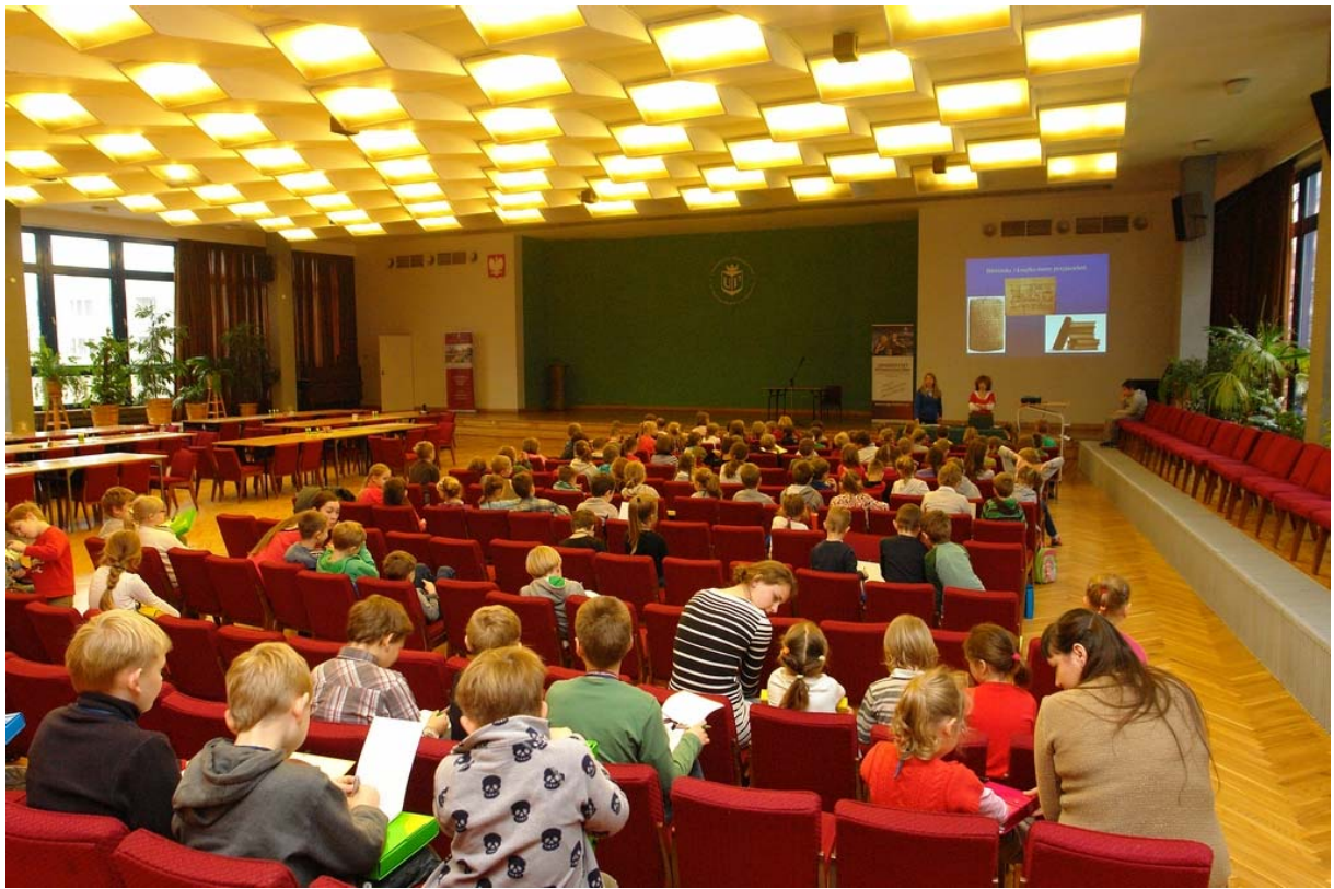
Zdj. 2.

Kolejne zajęcia Biblioteka i książka moim przyjacielem miały za zadanie wyjaśnić dzieciom, czym jest księżnica oraz jakie są jej najważniejsze agendy. Ponadto została przedstawiona rola bibliotek i książek w życiu ludzi, mali studenci poznali rodzaje tych placówek. W dalszej części zajęć na podstawie utworów literackich oraz fragmentów bajek dzieci dowiedziały się, jak dbać o książki. Ponadto skupiono się na podkreśleniu wagi czytania oraz wartości obcowania z literaturą. Ukazano także proces powstawania książki oraz elementy, z których się one składają.