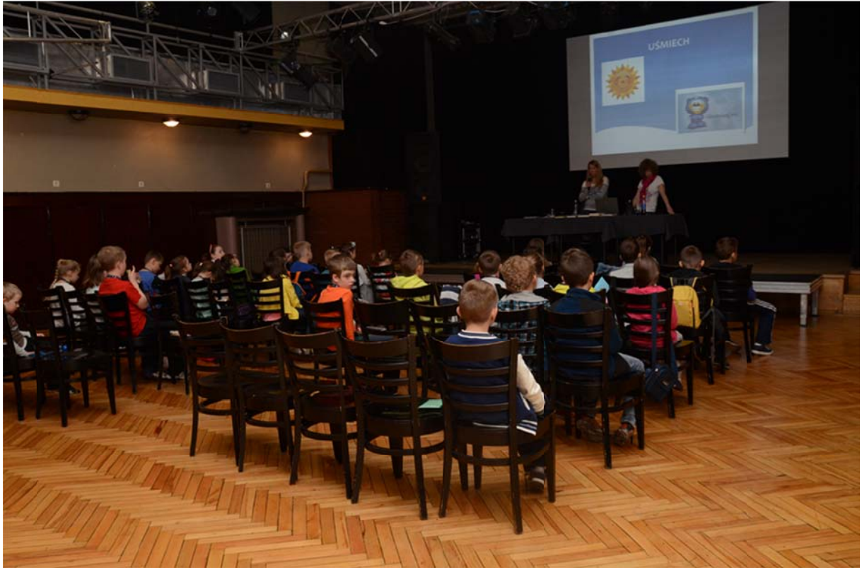
Zdj. 4.

Studenci Wadowickiego Uniwersytetu Dzieci byli uczestnikami spotkania zatytułowanego Być uprzejmym - nie jest źle, także na krańcach świata , którego tematyka została zmodyfikowana i wzbogacona o dodatkowe treści. Podczas zajęć zostały przekazane wiadomości związane z zasadami dobrego wychowania, a także poprawne formy zachowania i normy obyczajowe przyjęte w określonych sytuacjach. Podkreślone zostało znaczenie stosowania norm życia społecznego, które ułatwiają wspólne życie i zjednują szacunek otoczenia. Dzieciom zostały przypomniane zwroty grzecznościowe używane na co dzień oraz przykłady niewłaściwych zachowań.