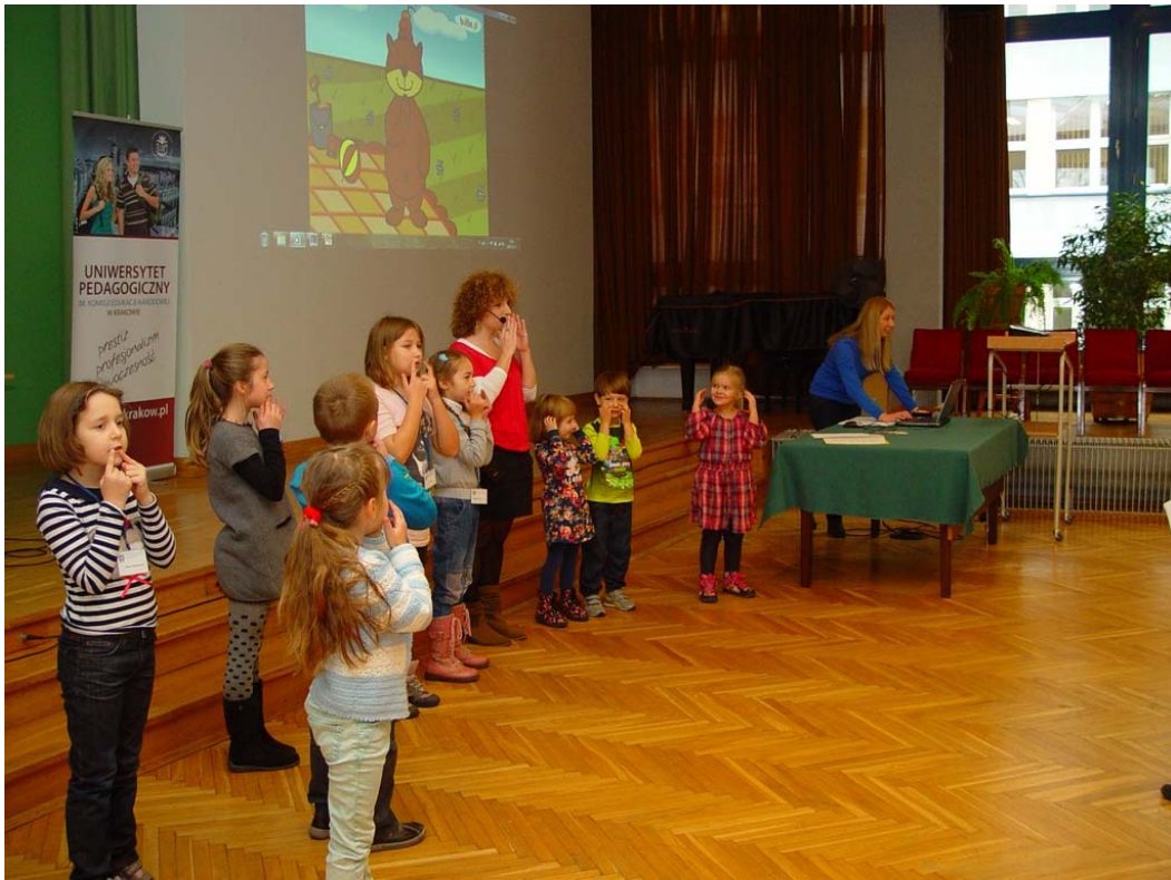
Zdj. 5.

W trakcie zajęć z małymi studentami wykorzystano elementy zabawy. Skłania to najmłodszych do współdziałania oraz w ten sposób łatwiej przekazać dzieciom wiadomości i zachęcić je do podjęcia wysiłków związanych z poznawaniem nowych treści. Autorki artykułu posługiwały się podczas spotkań różnymi metodami pracy, jak np. małe formy teatralne: krótkie inscenizacje oraz recytacje. Ponadto zajęcia były urozmaicone grami i zabawami w formie układanek, rozsypanek, zgadywanek, a także warsztatami plastycznymi np. wykonywaniem ilustracji do ulubionej bajki.