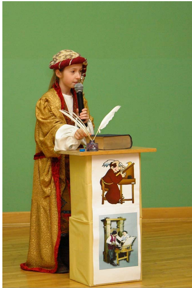
Zdj. 1.

Zajęcia Opowieści o książce - skąd, dla kogo, po co? miały za zadanie zapoznanie małych studentów z dziejami książki od czasów prehistorycznych do współczesności, pokazanie pierwotnych sposobów zapisu i przekazywania informacji na przestrzeni dziejów oraz podkreślenie rangi książek w życiu ludzi. Zostały uzupełnione inscenizacją oraz odpowiednią scenografią do każdego omawianego przedmiotu czasowego.