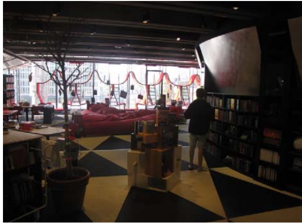
Zdj. 12. Tiotretton (Biblioteka dla dzieci w wieku 10-13 lat).