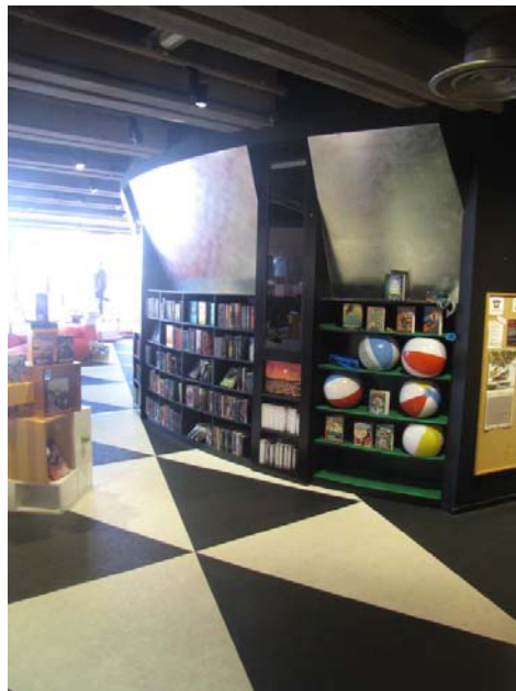
Zdj. 13. Tiotretton (Biblioteka dla dzieci w wieku 10-13 lat).