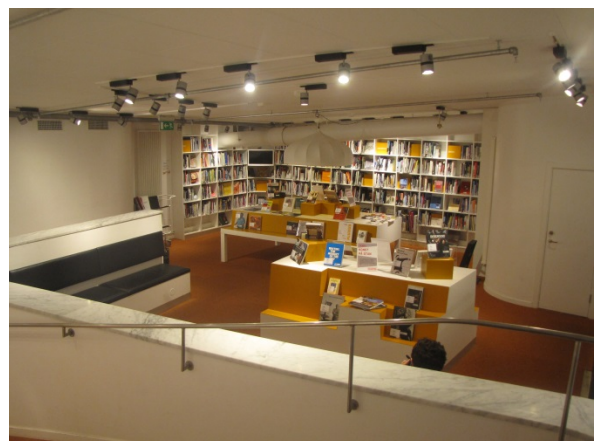
Zdj. 4 i 5. Bibliotek Plattan. Fot. S. Sobczyk.