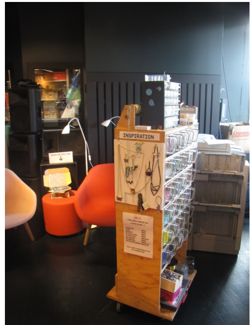
Zdj. 16 i 17. Lava Bibliotek and Verkstad.