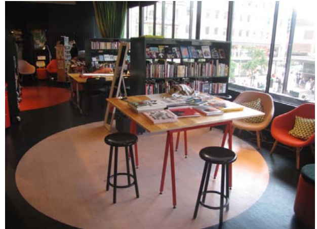
Zdj. 14 i 15. Lava Bibliotek and Verkstad.