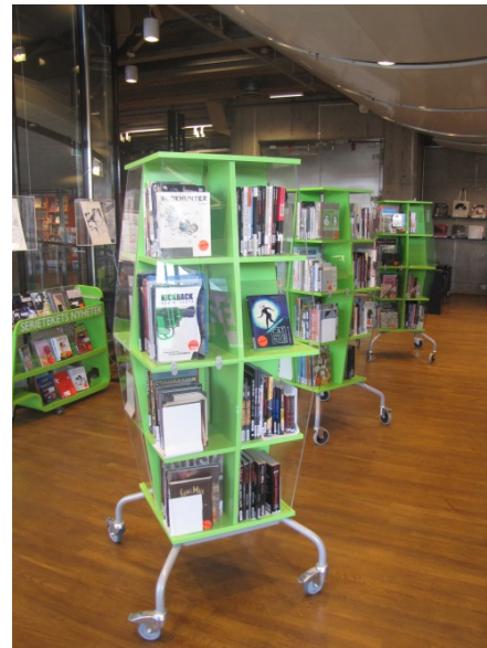
Zdj. 7 i 8. Film and Musik Bibliotek oraz Serieteket.