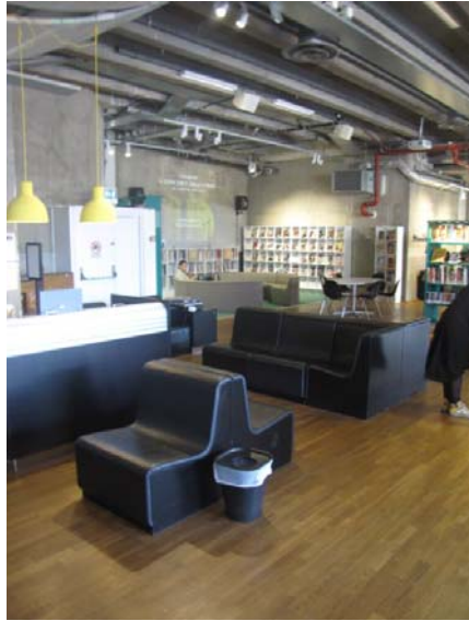
Zdj. 9. Film and Musik Bibliotek oraz Serieteket.