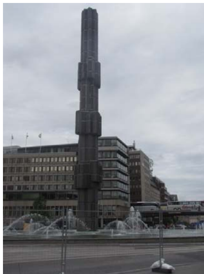
Zdj. 1. Szklany obelisk „Kryształ - pionowy akcent w szkłe i stali”.

W latach 50. i 60. XX wieku rozpoczął się w Sztokholmie okres odbudowy i rewitalizacji urbanistycznej.[6] Centralnym punktem miasta został - znajdujący się w dzielnicy Normalm - Sergels Torg (Plac Sergela), nazwany na cześć XVIII-wiecznego szwedzkiego rzeźbiarza Johana Tobiasa Sergela, który miał swój warsztat po północnej stronie dzisiejszego placu. Korzystając z rozwiązań urbanistycznych, podpatrzonych w dużych miastach europejskich (takich jak Stuttgart, Paryż, Coventry czy Londyn), Sergels Torg podzielono na trzy odrębne części: 1) położony najniżej plac dla pieszych w kształcie trójkąta (potocznie określane przez Szwedów jako Plattan), z szerokimi schodami prowadzącymi na Drottninggatan - ulicę dla pieszych, łączącą Stare Miasto (Gamla Stad) na południu z Kungsgatan na północy; 2) położone na wyższym poziomie duże rondo, ze zjazdem na trzy główne ulice miasta; 3) niewielką, otwartą przestrzeń, z widokiem na 5-piętrowy biurowiec Hötorgshusen, od którego na północ rozciąga się ulica Sveavägen. W centralnym punkcie tego węzła komunikacyjnego znajduje się dzisiaj 37-metrowy, szklany obelisk pod intrygującą nazwą „Kryształ – pionowy akcent w szkłe i stali” („Kristall - vertikal accent i glas och stål”), autorstwa Edvina Öhrströma (Zdj. 1).