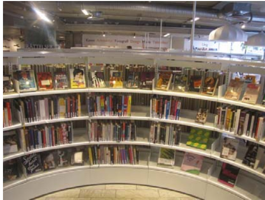
Zdj. 6. Bibliotek Plattan.