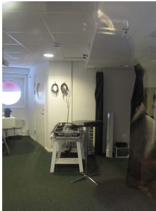
Zdj. 18. Lava Bibliotek and Verkstad.