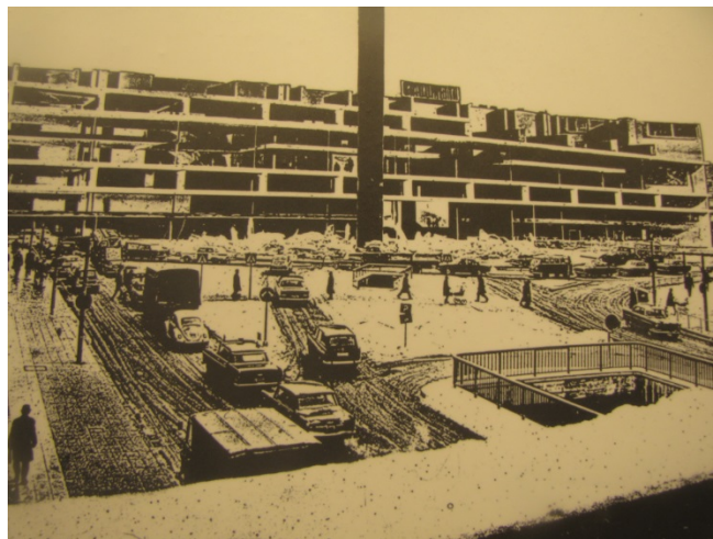
Zdj. 2. Kulturhuset w trakcie budowy (fotografia wykonana z makiety historycznej wystawionej w holu Kulturhuset).

Budowę Kulturhuset rozpoczęto w 1968 roku, a ostatecznie zakończono w roku 1974 (Zdj. 2). Wschodnią część budynku otwarto w 1971 roku, podczas wiosennej sesji szwedzkiego parlamentu, który przeniósł tam swoje obrady na okres przebudowy Rikstagu (do 1983 roku).[10] Przez 3 lata w części budynku stanowiącej dzisiaj siedzibę Teatru Miejskiego (Stadsteatern) obradowała Conference on Security and Co-operation in Europe. Ostatecznie całość budynku Kulturhuset Stadsteatern w Sztokholmie przekazano na potrzeby kultury i sztuki dopiero w 1990 roku.