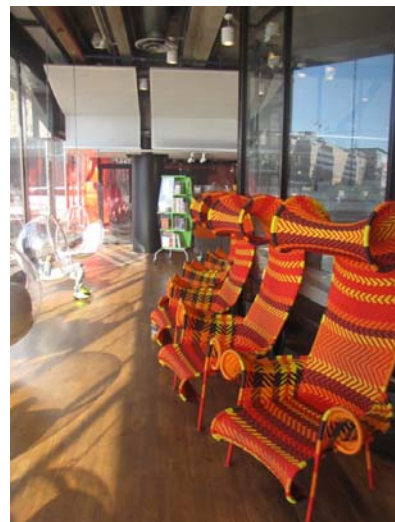
Zdj. 10 i 11. Serieteket (Komiksoteka).