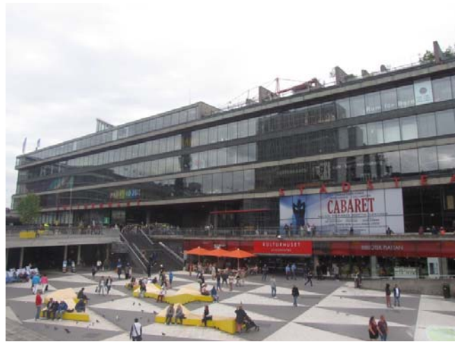
Zdj. 3. Budynek Kulturhuset.