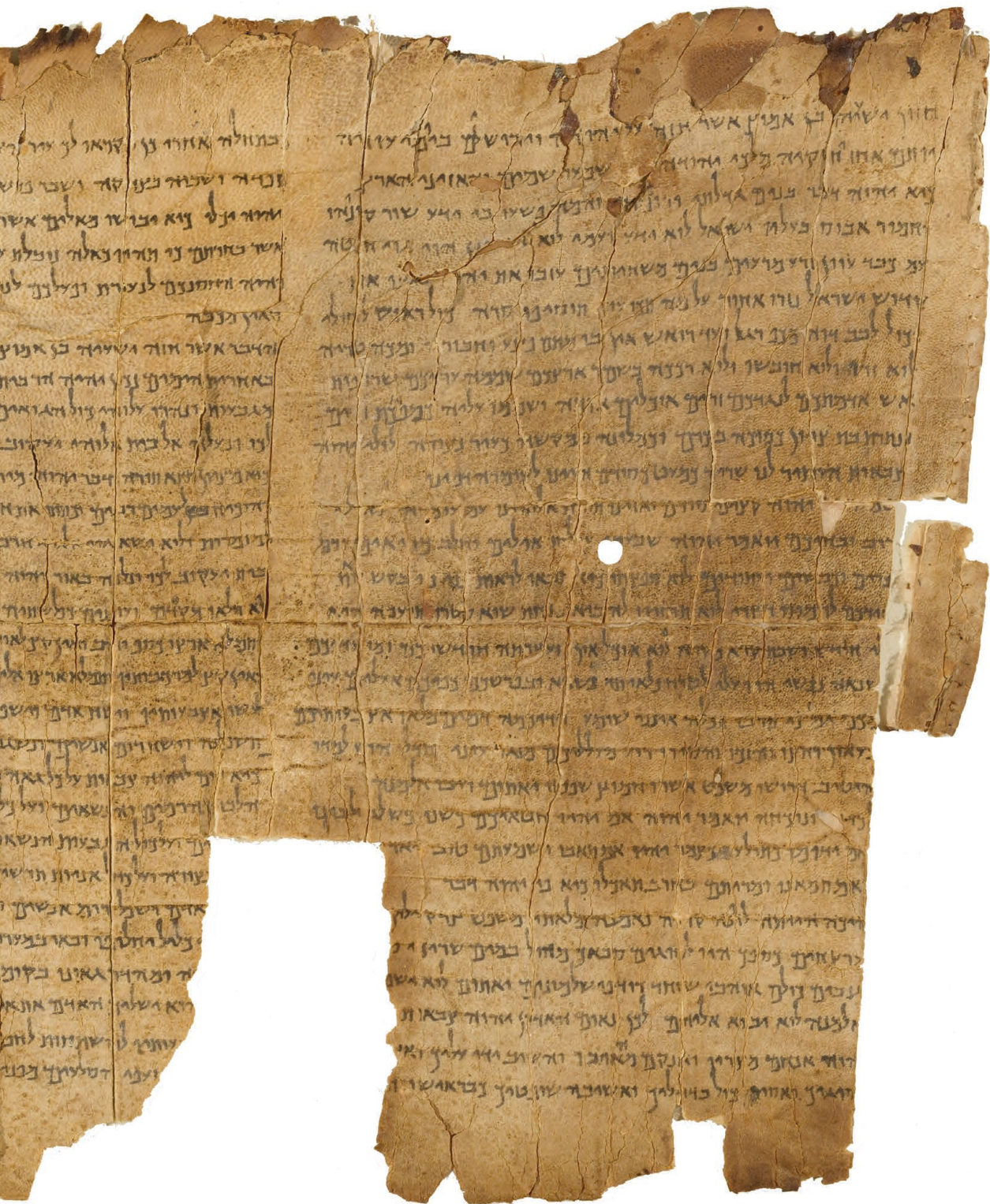
Zdj. 9. Wielki Zwój Izajasza dostępny dzięki Projektowi Cyfrowemu Zwojów Morza Martwego Muzeum Izraela.