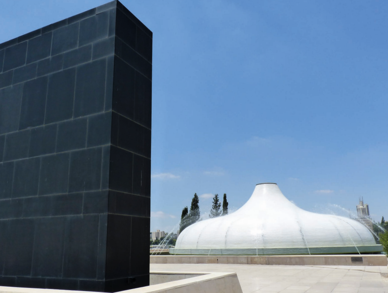
Zdj. 5. W kolorach i kształtach białej kopuły i czarnej bazaltowej ściany budynku doszukać się można symbolicznego odniesienia do przedstawionego w jednym z manuskryptów w zwojach dialogu „Synów Światła” z „Synami Ciemności”.

Naprzeciw białej kopuły znajduje się czarna bazaltowa ściana. W kolorach i kształtach budynku można się doszukiwać symbolicznego odniesienia do przedstawionego w jednym z manuskryptów dialogu „Synów Światła” z „Synami Ciemności”. Mimo, że kopuła i czarna ściana wydają się być oddzielnymi konstrukcjami, tak naprawdę są połączone pod ziemią, tworząc zwartą, jednolitą całość. Wnętrze głównego pomieszczenia o opływowej formie mieści bibliotekę z tekstami umieszczonymi pod paraboliczną kopułą. Do wnętrza wpada słup światła, tworząc kolumnę iluminującą część wałka ejc chaim , wieńczącego gablotę ze zwojami.