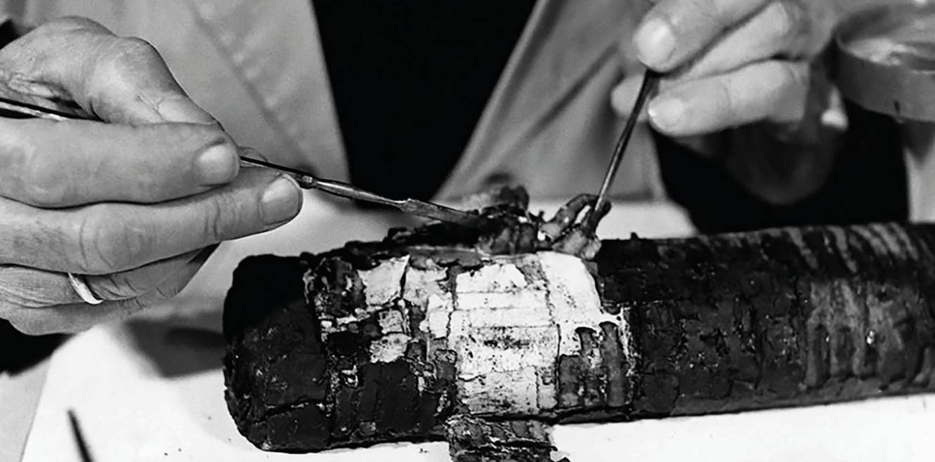
Zdj. 8. Badanie zwojów.