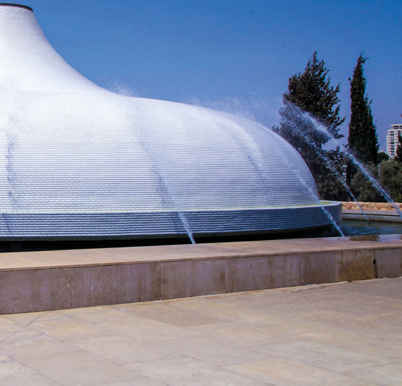
Zdj. 4. Kopała Sanktuarium Księgi kształtem przypomina pokrywy glinianych dzbanów, w których odnaleziono zwoje.