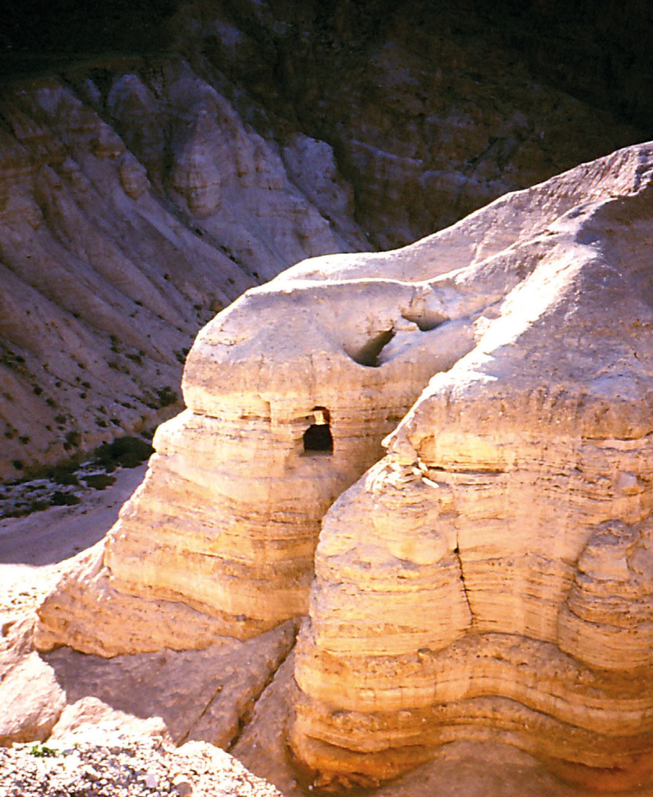
Zdj. 1. Groty w Qumran.