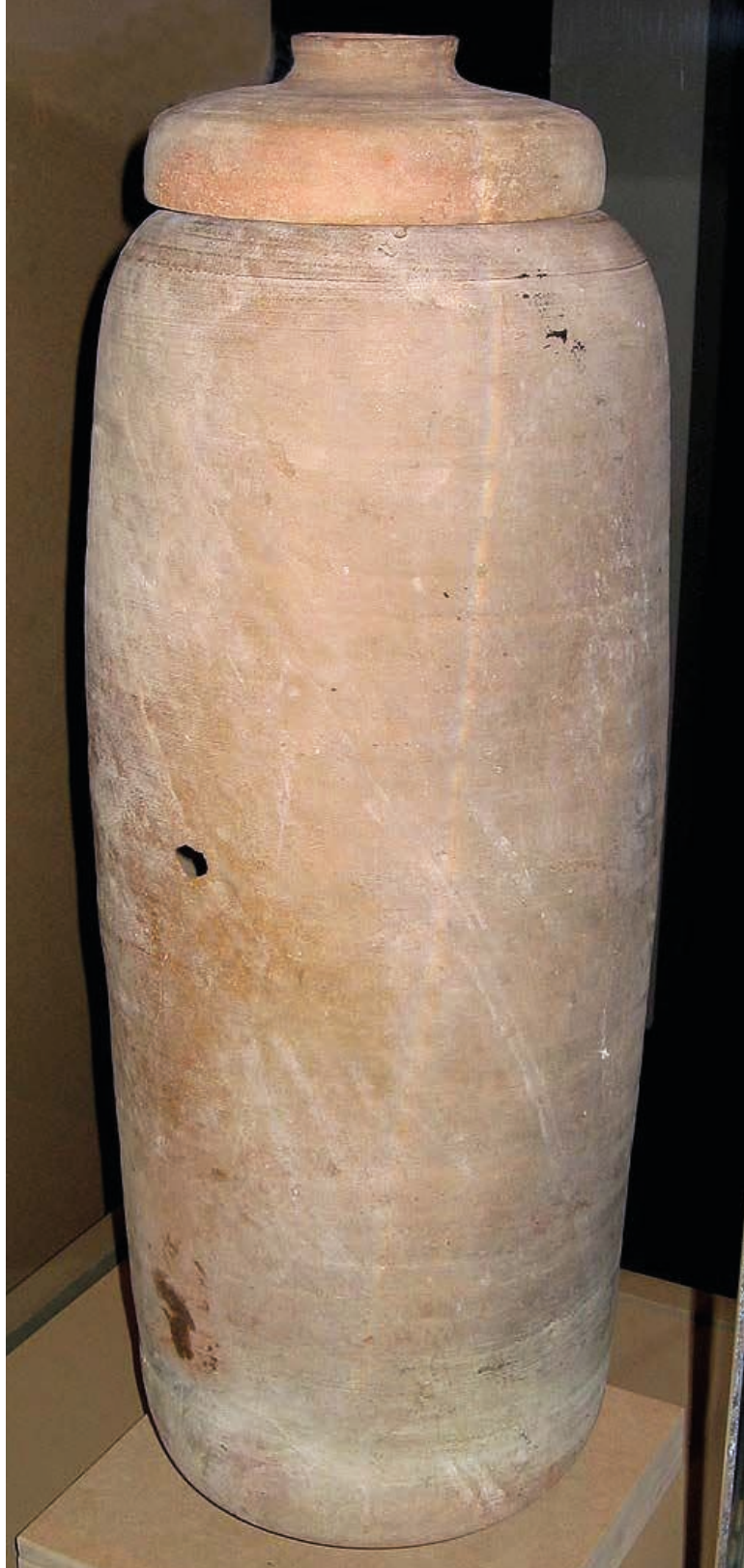
Zdj. 3. W rejonie Morza Martwego rękopisy przechowywano w glinianych naczyniach ukrytych w jaskiniach.