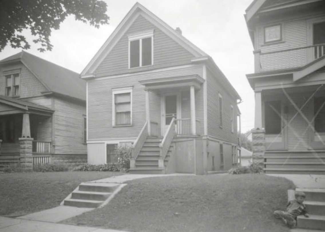
Fot. 3. Typowy dom w dzielnicy polskiej w Milwaukee w 1941 r.