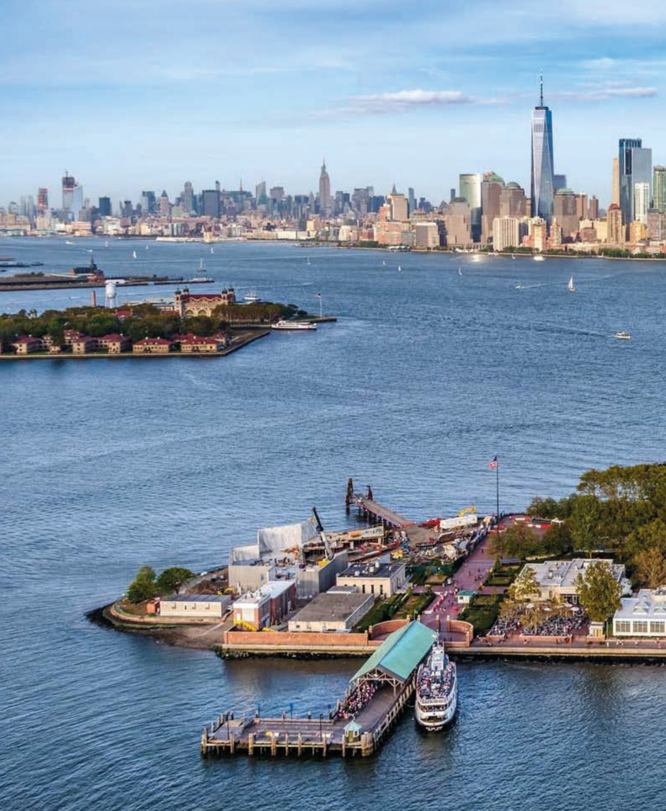
Fot. 1. Ellis Island i Statua Wolności w Nowym Jorku.